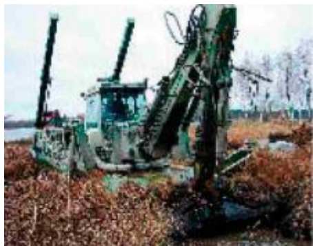
Watermaster приступает к работе

У вас есть финский летний домик на берегу красивого озера, но берег озера покрыт илом и так сильно зарос, что пляж нельзя использовать. К кому вы обратитесь?