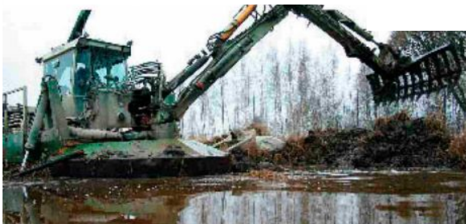
Грابل Watermaster оказались идеальным инструментом