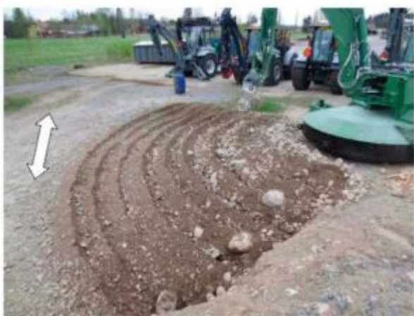
Слежавшийся гравий, поперечное движение

Измельченная почва удаляется с помощью режущего землесоса или обратного ковша