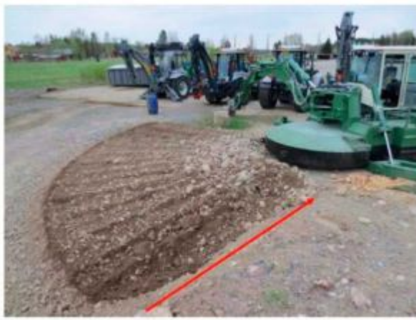
Слежавшийся гравий, продольное движение